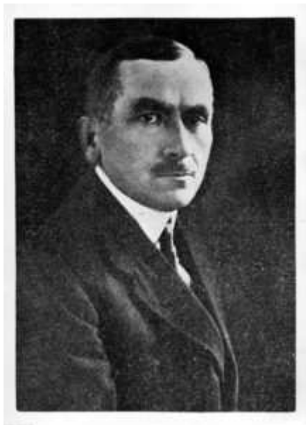
Roman Dmowski

Wkrótce po tym, w nocy z 6 na 7 listopada 1918 roku Daszyński stanął na czele Tymczasowego Rządu Ludowego Republiki Polskiej w Lublinie, który ogłosił bardzo postępowo-demokratyczny program reform społeczno-gospodarczych. Piłsudski po swym powrocie do kraju widział Daszyńskiego w roli pierwszego premiera niepodległej Polski, jednak kandydatura ta została zablokowana przez Narodową Demokrację. Skupiając się odtąd na pracy parlamentarnej był Daszyński naturalnym liderem Polskiej Partii Socjalistycznej, równocześnie wciąż popierał poczynania Piłsudskiego. Zmieniło się to po Maju 1926 roku – Daszyński stał się on jednym z przywódców opozycji wobec autorytarnych rządów piłsudczyków. Od początku lat 30. Daszyński chorował i nie mógł już tak jak dawniej angażować się w działalność polityczną, aczkolwiek sympatyzował z Centrolewem. Zmarł 31 października 1936 roku.