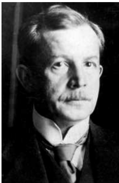
Wojciech Korfanty (domena publiczna)

Wojciech Korfanty (1873-1939), polityk, działacz narodowy i niepodległościowy, redaktor i publicysta, wydawca górnośląskiego „Polaka”, poseł do Reichstagu, polski komisarz plebiscytowy na Górnym Śląsku, faktyczny dyktator III powstania śląskiego, poseł na Sejm RP oraz do Sejmu Śląskiego, przywódca Chadecji, sądzony i skazany w procesie brzeskim, od 1935 roku na emigracji w Czechosłowacji, współtwórca opozycyjnego wobec sanacji tzw. Frontu Morges, wiosną 1939 roku powrócił do kraju, gdzie wkrótce zmarł.