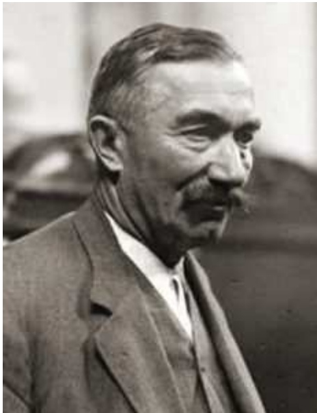
Wincenty Witos

W tym samym czasie Piłsudski stał również na czele polskiej armii, dowodząc nią m.in. podczas wojny polsko-bolszewickiej, w której odniósł słynne zwycięstwo w bitwie warszawskiej w sierpniu 1920 roku. Od połowy 1923 roku, rezygnując z udziału w życiu politycznym, oddawał się w głównej mierze pracy pisarskiej i odczytom, budując równocześnie i rozszerzając zaplecze swych zwolenników. W maju 1926 roku przeprowadził zbrojny zamach stanu przejmując władzę w Polsce. Choć oficjalnie piastował jedynie stanowisko Głównego Inspektora Sił Zbrojnych oraz Ministra Spraw Wojskowych, to w rzeczywistości aż do śmierci był faktycznym dyktatorem państwa polskiego. Zmarł 12 maja 1935 roku.