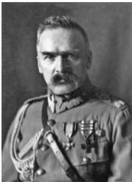
Józef Piłsudski (domena publiczna)

Józef Piłsudski (1867-1935), działacz niepodległościowy, I Marszałek Polski, Naczelny Wódz Wojska Polskiego, jeden z twórców i przywódców Polskiej Partii Socjalistycznej oraz jej Organizacji Bojowej, kierownik Związku Walki Czynnej, w czasie I wojny światowej Komendant I Brygady Legionów Polskich, twórca Polskiej Organizacji Wojskowej, w Drugiej Rzeczypospolitej m.in. Naczelnik Państwa Polskiego, po przejęciu władzy w maju 1926 r. dwukrotnie premier, w latach 1926-1935 minister spraw wojskowych oraz Generalny Inspektor Sił Zbrojnych, faktyczny przywódca państwa polskiego.