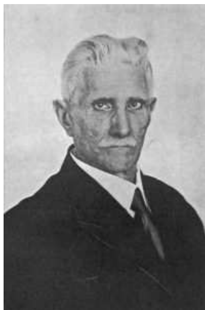
Ignacy Daszyński (domena publiczna)

Ignacy Daszyński (1866-1936), polityk, pisarz polityczny i publicysta, działacz socjalistyczny i niepodległościowy, współtwórca Polskiej Partii Socjalno-Demokratycznej Galicji i Śląska Cieszyńskiego, poseł do austriackiej Rady Państwa, w listopadzie 1918 r. premier Tymczasowego Rządu Ludowego Republiki Polskiej, w okresie Drugiej Rzeczypospolitej jeden z liderów Polskiej Partii Socjalistycznej, Marszałek Sejmu (1928-1930) oraz jeden z przywódców Centrolewu.